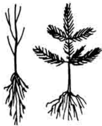
PLANTULAS A RAÍZ DESNUDA

Busque las siguientes características físicas en sus árboles: